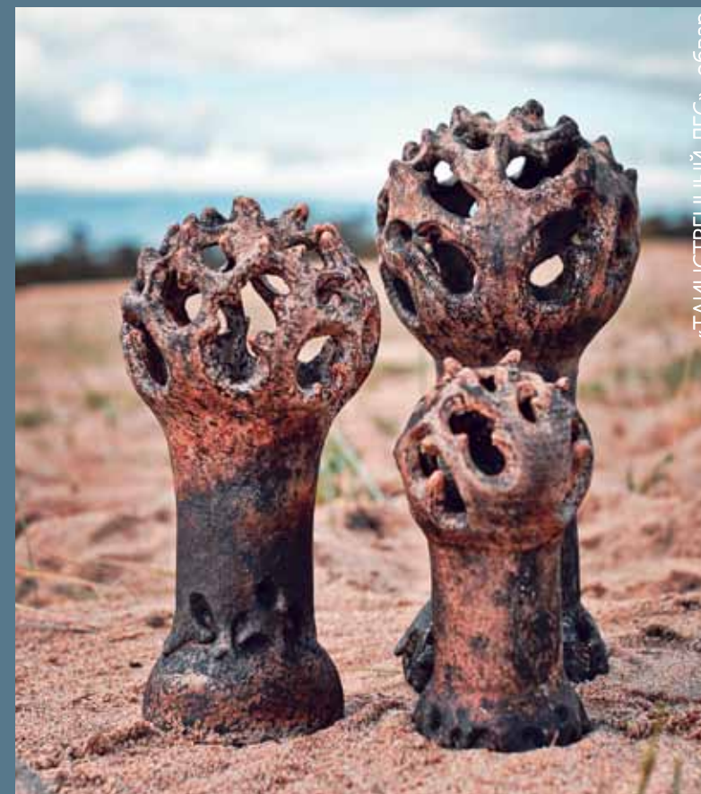
«ТАИНСТВЕННЫЙ ЛЕС», обвар