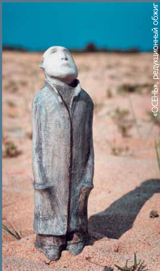
«ОСЕНЬ», редуционный обжиг