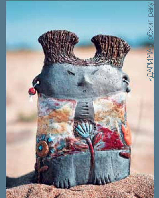
«ДАРИМА», обжиг раку