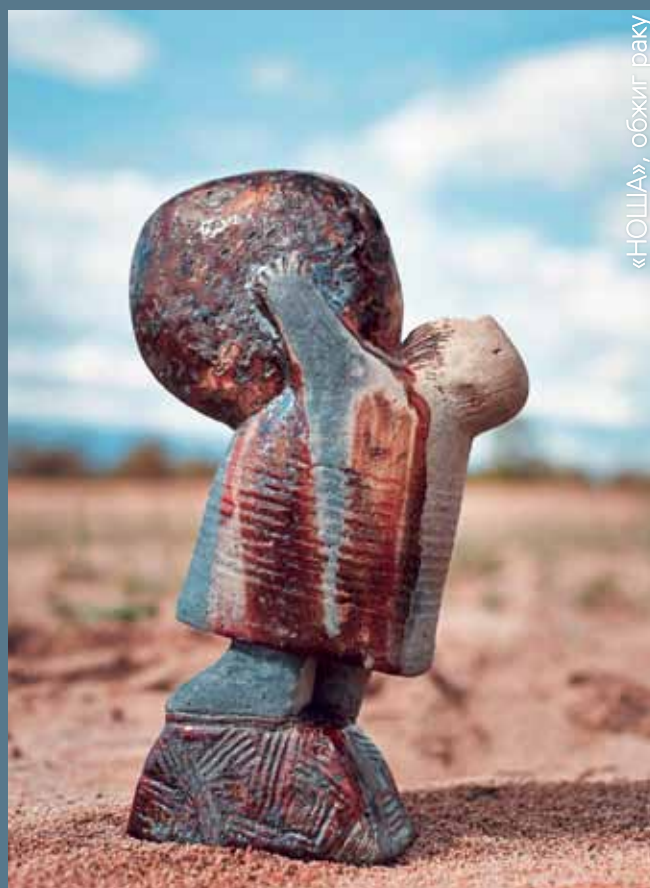
«НОША», обжиг раку

Участие в симпозиуме - это не просто возможность длительное время работать без перерыва, не отвлекаясь на бытовую суету. Вдали от города, в непривычной для себя обстановке, в двух шагах от Байкала, мы меняемся. Я стала счастливее! Голова идет кругом от общения с интересными, интересующимися, ищущими, экспериментирующими людьми, от длительного пребывания на просторах Ольхона под его огромным, бескрайним небом.