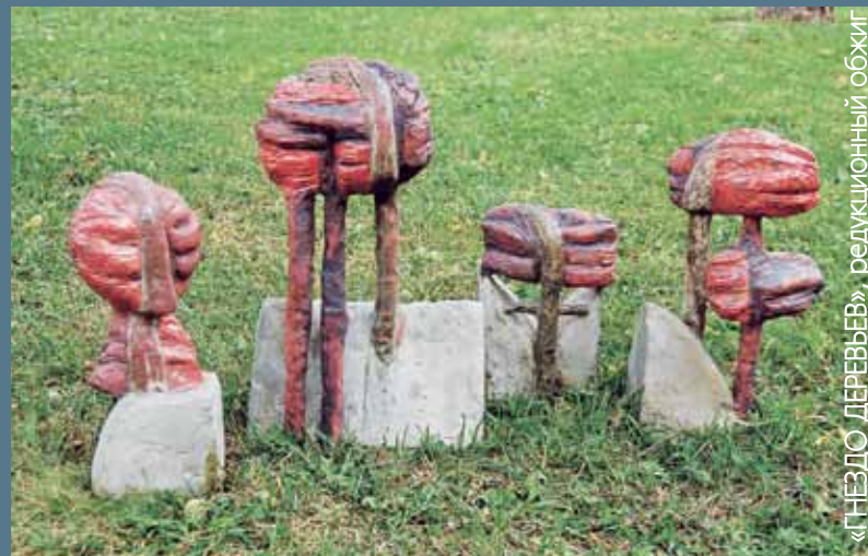
«ГНЕЗДО ДЕРЕВЬЕВ», редуционный обжиг