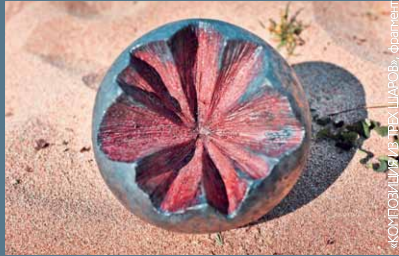
«КОМПОЗИЦИЯ ИЗ ТРЕХ ШАРОВ», фрагмент

Это уже четвертый пленэр по керамике раку, в котором я участвую: был в Белоруссии, в Приморском крае на острове Попова, в прошлом году был на симпозиуме здесь же на Ольхоне. Сравнить есть с чем. Здесь на Байкале, конечно, динамика положительная. Такой симпозиум многое дает. Сейчас собираюсь в Хабаровске ставить печь раку. Общение! Там, где керамика не развита, там такое общение очень нужно. Уже после симпозиума начинается просветительская деятельность. Здесь впечатления видны по уровню работ, на местах такого отклика нет. Ольхон – это Ойкумена. Мне близки этнические мотивы, а здесь они живут.