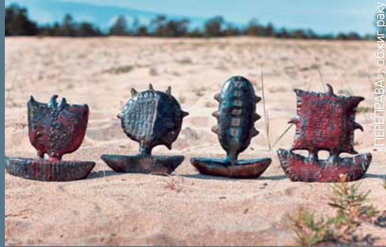
«ПЕРЕПРАВА», обжиг раку

Я на симпозиуме впервые. Вначале сомневалась, ехать сюда или нет. Но когда приехала, не пожалела об этом. Привезла сюда эскизы, но здесь их переработала. Я первый раз работаю в полевых условиях. Дома долго лепишь, а здесь надо быстро. Я впервые работала в раку, в восстановительном обжиге. В июле у нас в Новосибирске будет симпозиум по огненной скульптуре, уже там что-то использую, с чем познакомилась здесь. Ольхон, конечно, наложил отпечаток на работы. Спасибо организаторам за такую возможность. Ты лепишь, не думая об обжиге, тебе обожгут, помогут, расскажут. Спасибо!