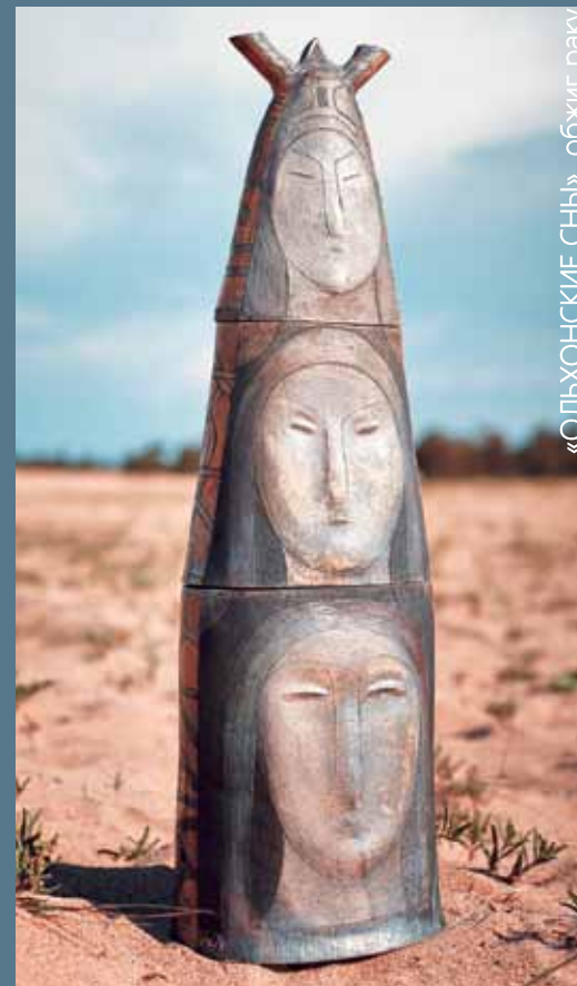
«ОЛЬХОНСКИЕ СНЫ», обжиг раку