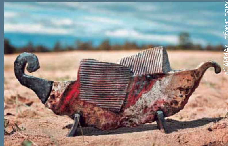
«САРМА», обжиг раку

«Байкал-КераМистика» – это яркий букет эмоций - захватывающие впечатления от места Силы и знакомства с новыми друзьями, магия керамики, сверкающей под ночным небом и звёзды над головой, тёплый приём и гостеприимность, радость общения и погружение в себя, меняющееся каждую минуту небо и мощь Байкала и, наконец, надежда на новые встречи! Такое не забывается! Вселенское спасибо организаторам и помогай Вам Бог!