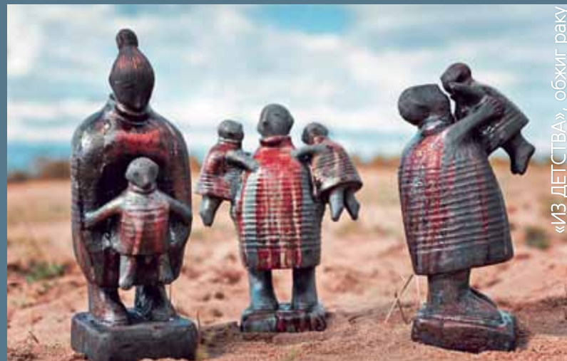
«ИЗ ДЕТСТВА», обжиг раку

Впечатления от симпозиума очень хорошие. Организация на высоком уровне со всех сторон. Очень насыщенная программа: работа, поездки интересные. Практически, все, что задумал, все получилось. К байкальским темам смог подобраться, когда походил по Байкалу, отсюда и родились «Ольхонские встречи». Сакральное место стимулирует творческую деятельность. Я впервые работал в раку, сложной по декору, в которой делать надо сразу. Делал вслепую, но интересно. Только когда поработал, понял, как надо делать. Радует общение с людьми, с которыми знаком, со многими здесь познакомился. Увожу хорошие воспоминания.