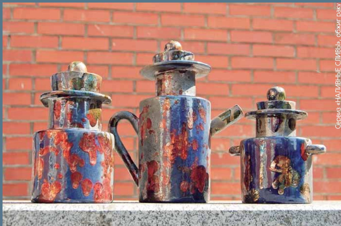
Сервиз «НАЛИВНЫЕ СЛИВЫ», обжиг раку

Я благодарна Вселенной, своей семье, коллегам, участникам за то, что состоялся этот симпозиум, за то, что есть у нас Байкал, за то, что существует возможность пригласить сюда близких по духу людей, за то, что вы все такие открытые и талантливые, за то, что в России стало больше людей, которых я люблю и уважаю.