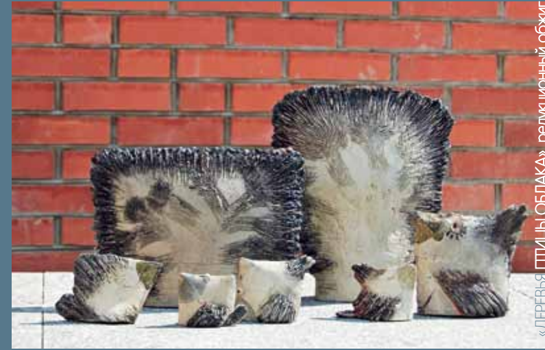
«ДЕРЕВЬЯ ПТИЦЫ ОБЛАКА», редуционный обжиг

Это счастье - работать на Ольхоне, чувствуя себя частичкой Байкала. Море, горы, сосны радовали наши глаза, когда мы лепили. Корнями деревьев, за сотни лет вымоченными водой Байкала, и осколками Ольхонских камней мы отпечатывали фактуры на нашей глине. Это солнце и воздух Ольхона высушивали наши работы. Это ветер Ольхона раздувал огонь наших печей. Казалось, не только мы, 23 участника симпозиума, а сам Байкал создает керамику вместе с нами!