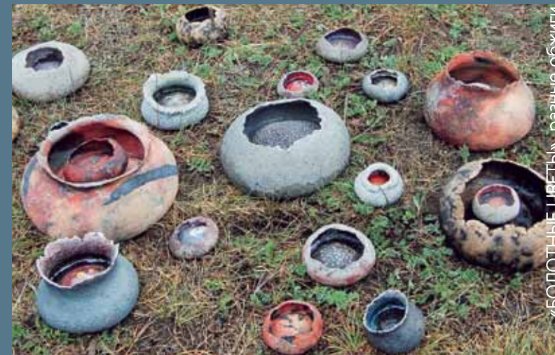
«БОЛОТНЫЕ ЦВЕТЫ», разные обжиги