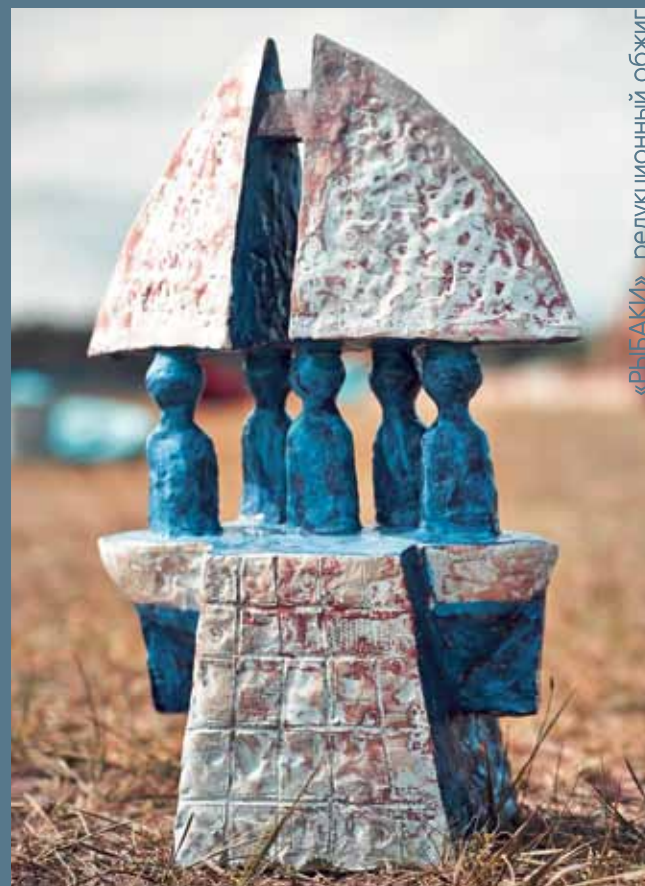
«РЫБАКИ», редуционный обжиг