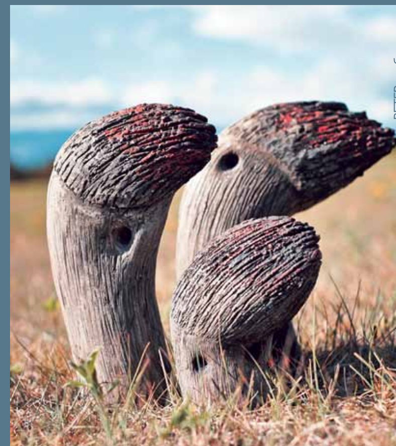
«ВЕТЕР», обжиг раку