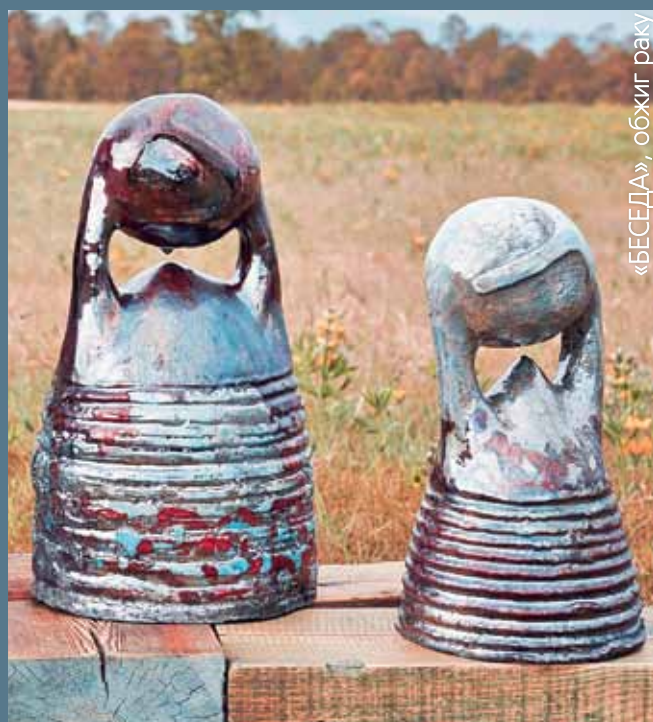
«БЕСЕДА», обжиг раку