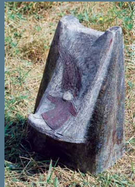
«ВВЕРХ», обжиг раку

Впечатления от симпозиума очень хорошие. Организация на высоком уровне со всех сторон. Очень насыщенная программа: работа, поездки интересные. Практически, все, что задумал, все получилось. К байкальским темам смог подобраться, когда походил по Байкалу, отсюда и родились «Ольхонские встречи». Сакральное место стимулирует творческую деятельность. Я впервые работал в раку, сложной по декору, в которой делать надо сразу. Делал вслепую, но интересно. Только когда поработал, понял, как надо делать. Радует общение с людьми, с которыми знаком, со многими здесь познакомился. Увожу хорошие воспоминания.