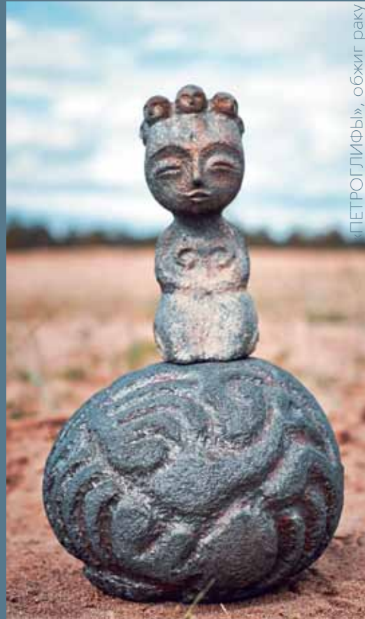
«ПЕТРОГЛИФЫ», обжиг раку