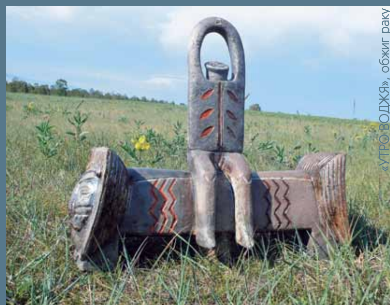
«УТРО ВОДЖЯ», обжиг раку