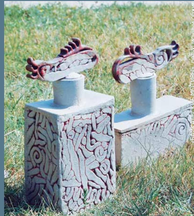
«БАЙКАЛЬСКИЕ МОТИВЫ», редуционный обжиг