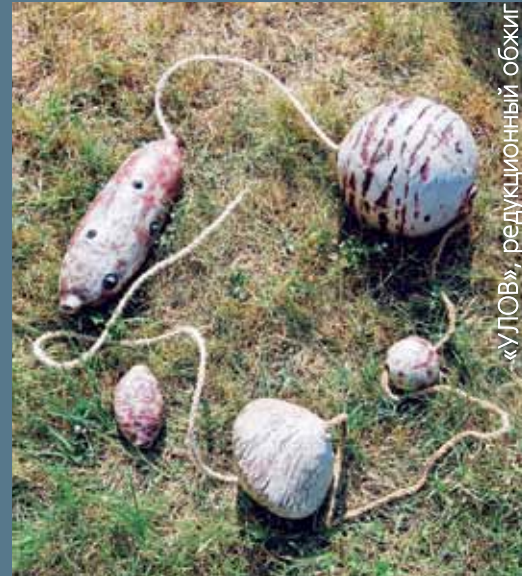
«УЛОВ», редуционный обжиг