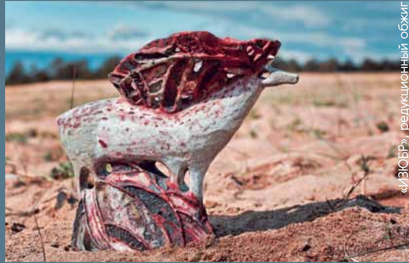
«ИЗЮБР», редуционный обжиг

Это счастье - работать на Ольхоне, чувствуя себя частичкой Байкала. Море, горы, сосны радовали наши глаза, когда мы лепили. Корнями деревьев, за сотни лет вымоченными водой Байкала, и осколками Ольхонских камней мы отпечатывали фактуры на нашей глине. Это солнце и воздух Ольхона высушивали наши работы. Это ветер Ольхона раздувал огонь наших печей. Казалось, не только мы, 23 участника симпозиума, а сам Байкал создает керамику вместе с нами!