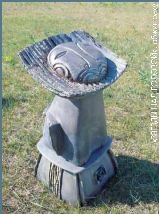
«ЗВЕЗДЫ НАД ГОЛОВОЙ», обжиг раку

Я участвовала в нескольких симпозиумах в Дзинтари, в Белоруссии, в Украине (Опошня). На Байкал хотела поехать, конечно, прежде всего, из-за природы, но кроме того, знала, что здесь будет много хороших художников, а это для меня важно. Здесь действительно очень высокий уровень мастеров. Считаю, что мастерство нужно для свободы творчества. Здесь непринужденная атмосфера, легко работается. Интересные и очень нужные мастер-классы.