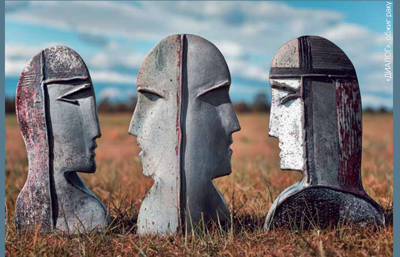
«ДИАЛОГ», обжиг раку