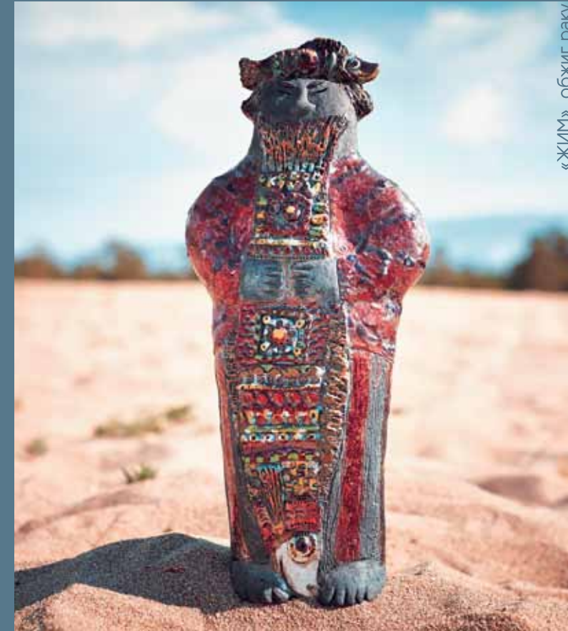
«ЖИМ», обжиг раку