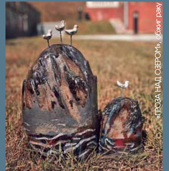
«ГРОЗА НАД ОЗЕРОМ», обжиг раку