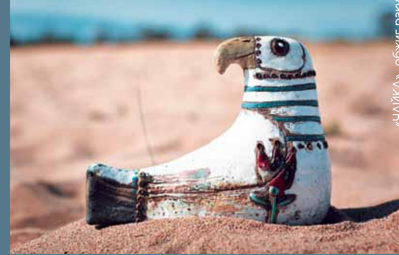
«ЧАЙКА», обжиг раку

Я на симпозиуме впервые. Вначале сомневалась, ехать сюда или нет. Но когда приехала, не пожалела об этом. Привезла сюда эскизы, но здесь их переработала. Я первый раз работаю в полевых условиях. Дома долго лепишь, а здесь надо быстро. Я впервые работала в раку, в восстановительном обжиге. В июле у нас в Новосибирске будет симпозиум по огненной скульптуре, уже там что-то использую, с чем познакомилась здесь. Ольхон, конечно, наложил отпечаток на работы. Спасибо организаторам за такую возможность. Ты лепишь, не думая об обжиге, тебе обожгут, помогут, расскажут. Спасибо!