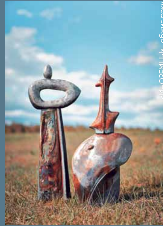
«ИНОЗЕМЦЫ», обжиг раку

Это уже четвертый пленэр по керамике раку, в котором я участвую: был в Белоруссии, в Приморском крае на острове Попова, в прошлом году был на симпозиуме здесь же на Ольхоне. Сравнить есть с чем. Здесь на Байкале, конечно, динамика положительная. Такой симпозиум многое дает. Сейчас собираюсь в Хабаровске ставить печь раку. Общение! Там, где керамика не развита, там такое общение очень нужно. Уже после симпозиума начинается просветительская деятельность. Здесь впечатления видны по уровню работ, на местах такого отклика нет. Ольхон – это Ойкумена. Мне близки этнические мотивы, а здесь они живут.