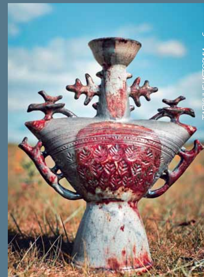
«ТАЕЖНЫЕ ИСТОРИИ», обжиг раку