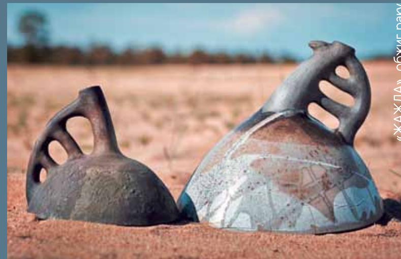
«ЖАЖДА», обжиг раку

Мы на керамических симпозиумах были неоднократно: два раза в Бобруйске, в Перми, в Кировской области в селе Рябово. Здесь нам очень нравится, подобралась хорошая группа, все вместе, каждый делится опытом. Кажется, ведь все уже известно, а какие-то мелочи открываешь для себя, и они очень нужны. Про организацию симпозиума можно сказать одно – она грамотная, все