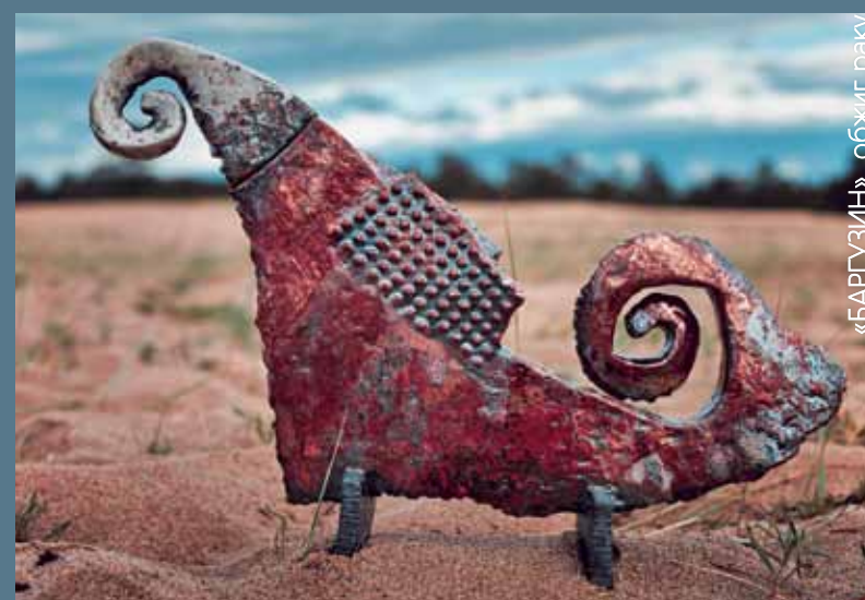
«БАРГУЗИН», обжиг раку