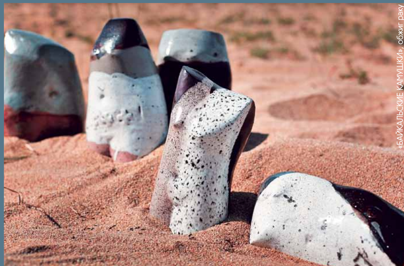
«БАЙКАЛЬСКИЕ КАМУШКИ», обжиг раку

Я здесь уже второй раз. Побывала на пленэре, на выставке. Это дало сильный толчок. Я преподаватель, даю многое ученикам, а здесь и сама учусь. Здесь много сильных мастеров, у которых есть, чему учиться. Люблю работать на природе, и здесь эта возможность есть. Вообще от симпозиума очень сильное впечатление: разнообразие стилей, способов декорирования. Очень понравились музыкальные инструменты, тоже теперь буду делать и детей учить, буду работать с пластилом.