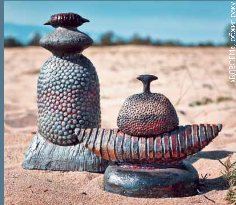
«ВДВОЕМ», обжиг раку

И в прошлом и в этом году одинаково хорошо. В прошлом году я напилась на целый год. В этом году я многое увидела, я думаю, отпечаток сохранится надолго. У всех разные способы мышления, подачи, все это видишь, воспринимаешь. С удовольствием обращаюсь к темам Байкала, Ольхона. Еще живы прошлогодние впечатления.