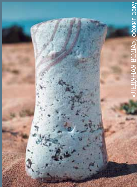
«ПЕДЯНАЯ ВОДА», обжиг раку

Еще осенью узнала об этом симпозиуме от сибиряков и решила, что поеду. В первую очередь хотела увидеть природу Байкала. На подобных симпозиумах не была много лет. Собственно впервые после Дзигтари участвую в таком мероприятии. Знала, что здесь будет много людей, которых я хорошо знаю, хотелось встретиться с друзьями. Я считала, что про керамику знаю все, но здесь узнала много нового, особенно в технологии. Здесь очень хорошо, я в восторге от всей группы. Спасибо всем!