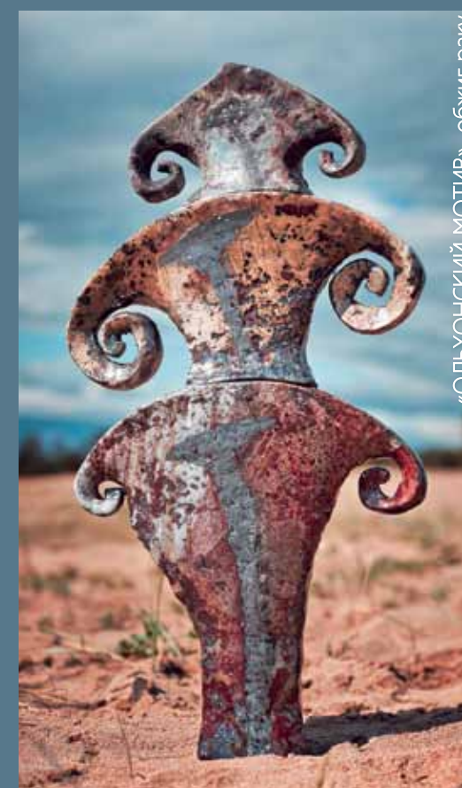
«ОЛЬХОНСКИЙ МОТИВ», обжиг раку