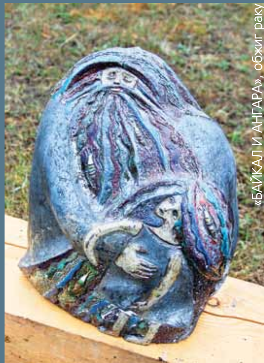
«БАЙКАЛ И АНГАРА», обжиг раку

Байкал - прекрасное место для симпозиума! Здесь я познакомилась с местными достопримечательностями и обычаями и узнала многих очень интересных и талантливых людей.