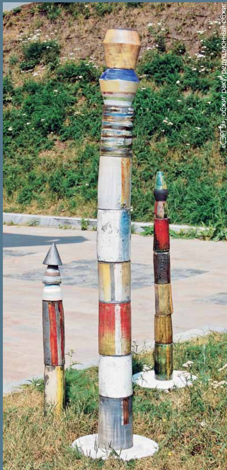
«СЭРГЭ», обжиг раку, редуционный обжиг