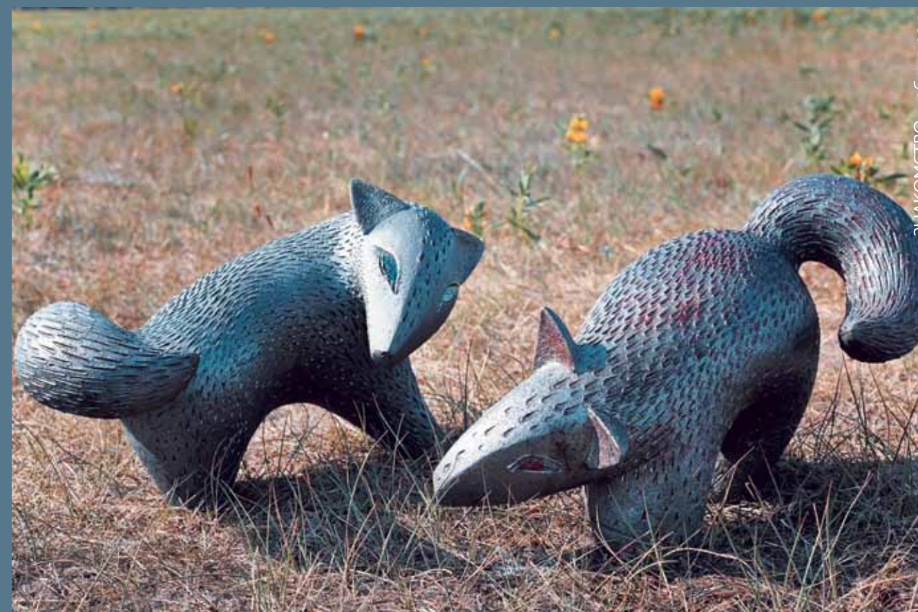
«ЗНАКОМСТВО», обжиг раку