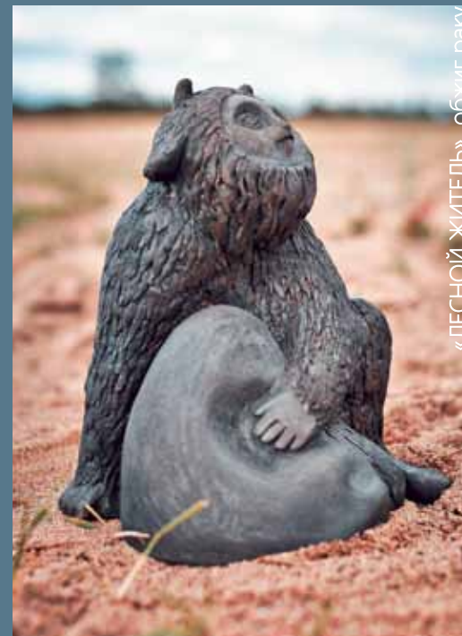
«ЛЕСНОЙ ЖИТЕЛЬ», обжиг раку