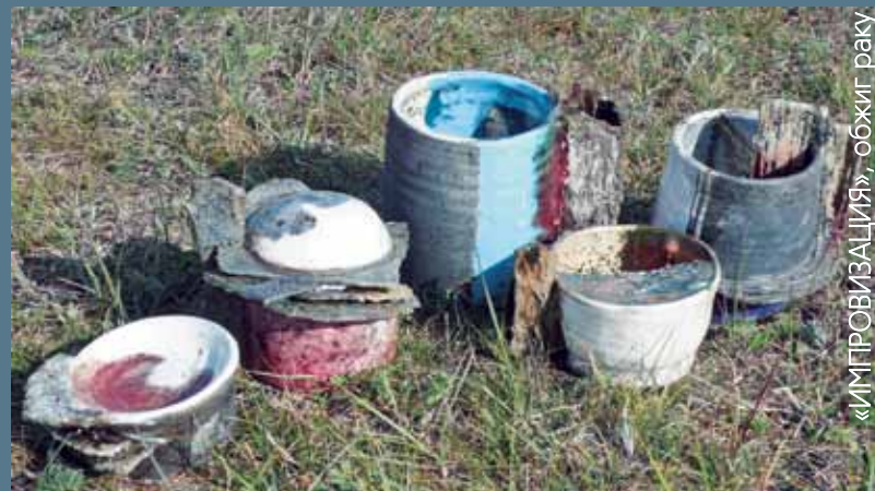
«ИМПРОВИЗАЦИЯ», обжиг раку

«Байкал-КераМистика» – это яркий букет эмоций - захватывающие впечатления от места Силы и знакомства с новыми друзьями, магия керамики, сверкающей под ночным небом и звёзды над головой, тёплый приём и гостеприимность, радость общения и погружение в себя, меняющееся каждую минуту небо и мощь Байкала и, наконец, надежда на новые встречи! Такое не забывается! Вселенское спасибо организаторам и помогай Вам Бог!