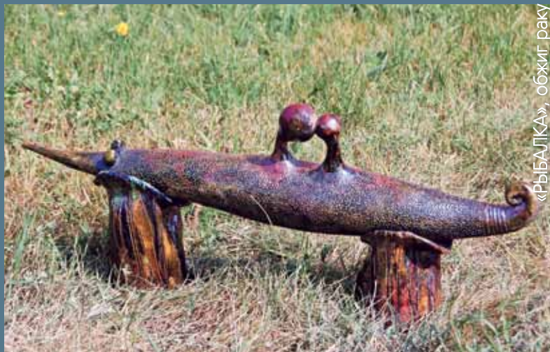
«РЫБА-ЛКА», обжиг раку

Хороший симпозиум. Я много опыта набрался, многое пересматриваю, хочется теперь работать по-другому. Многому научился, например, для меня фантастика – заделывание швов. А вообще все здорово – душевно, весело, хорошая команда, приятные творческие люди.