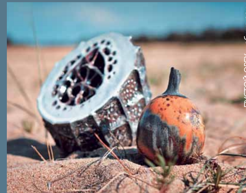
«ПУСТОЙ ОРЕХ», обжиг раку