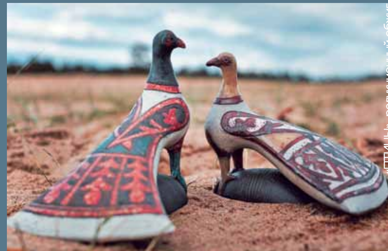
«ПТИЦЫ», редуционный обжиг