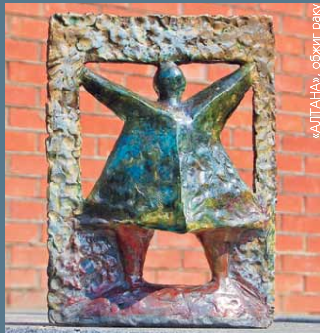
«АЛТАНА», обжиг раку

С детства мечтала побывать на Байкале. Было интересно: обжиги раку, которых я до этого не делала. Здесь узнала много технологических тонкостей. Байкал не разочаровал. Люди понравились. Привезла с собой эскизы, но делать по ним работы не стала, лишь один, и тот декорировала по-другому. А остальные работы родились уже здесь – Байкал подсказал. Здесь у всех получается хорошо – огонь помогает. Эффект неожиданности – «байкальское волшебство». Я очарована!