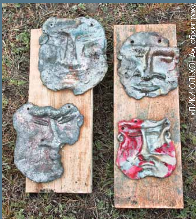
«ЛИКИ ОЛЬХОНА», обжиг раку

Работала на природе впервые. Для меня деревня вообще новое. Байкал просто потряс. Цвет изумрудный – все необыкновенно. Симпозиум на высоком уровне, все предусмотрено. Организаторы сделали все, чтобы мы работали. То, что я работала рядом с мастерами, мне как художнику молодому, многое дало. Конечно, я видела в интернете их работы, но это не то, надо видеть мастера, его приемы и сопоставлять с их изделиями. Я думаю, байкальского заряда мне надолго хватит.