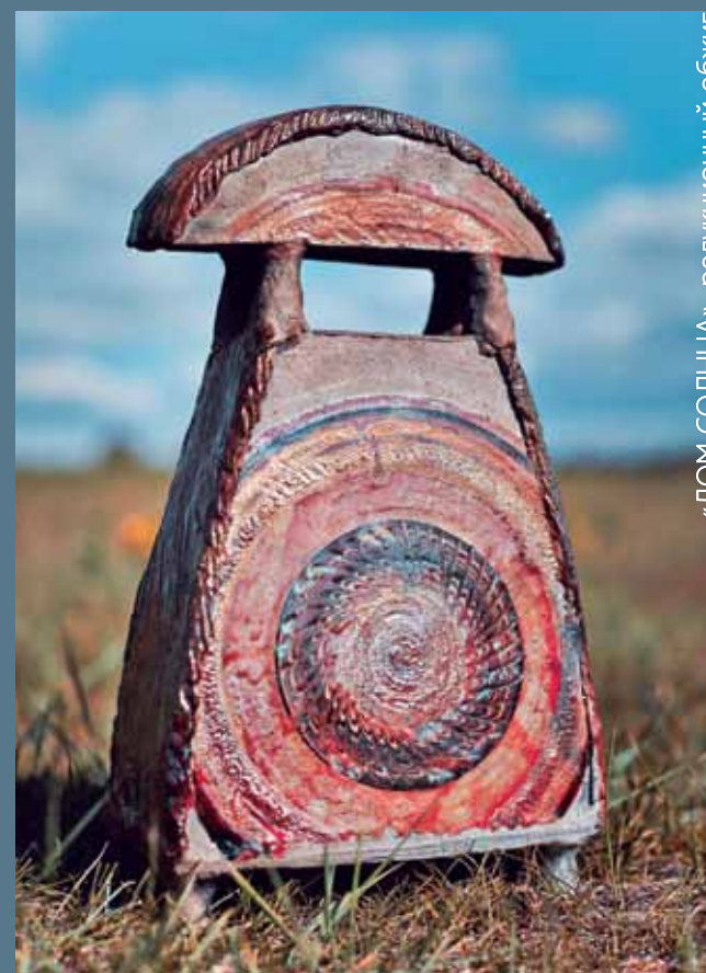
«ДОМ СОЛНЦА», редуционный обжиг