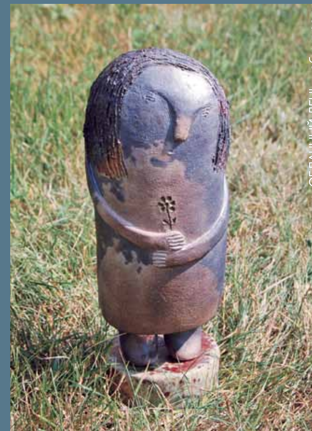
«ОБЛАЧНЫЙ ДЕНЬ», обжиг раку