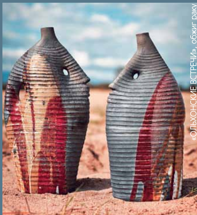
«ОЛЬХОНСКИЕ ВСТРЕЧИ», обжиг раку