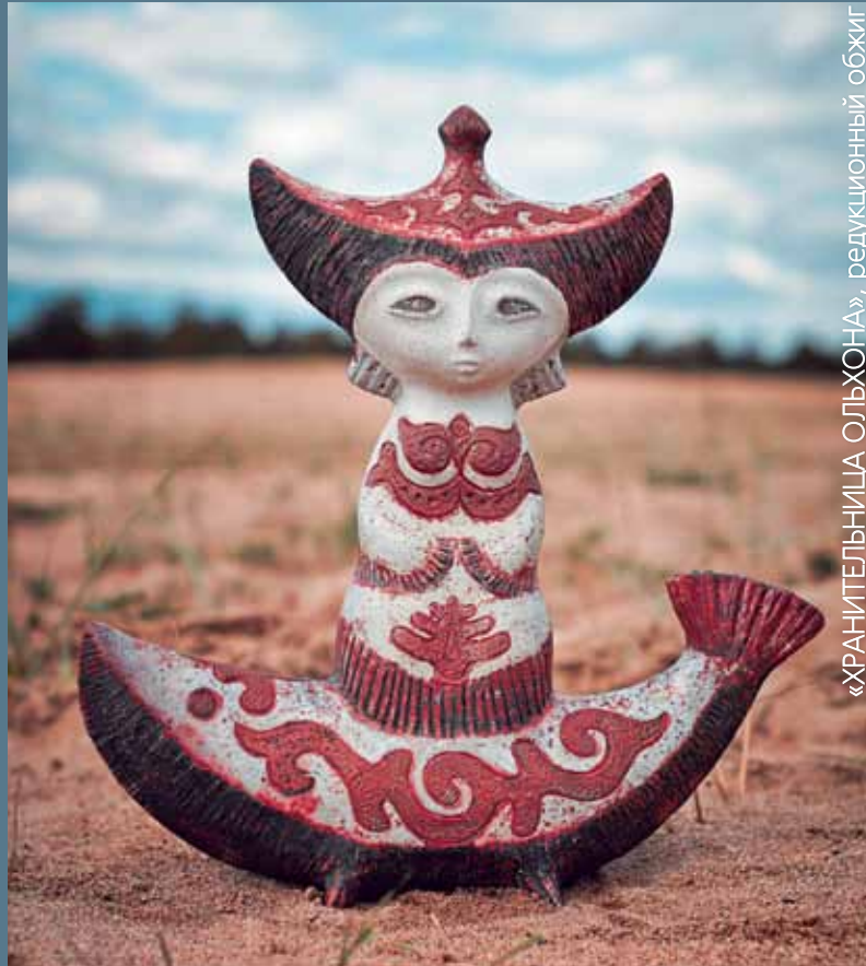
«ХРАНИТЕЛЬНИЦА ОЛЬХОНА», редуцированный обжиг

Я здесь так много наработала, потому что хорошо отлажена технологическая база. Интересны эксперименты с раку. А Байкал – это сказка! Все на контрастах. Ехала сюда, делала эскизы, но все поменялось. Много открыла для себя, и работу с бумажной глиной, и как «лечить» керамику, и еще много всего. Каждый мастер-класс – какие-то открытия.