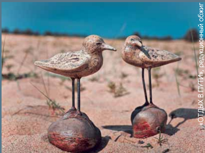
«ОТДЫХ В ПУТИ», редуционный обжиг