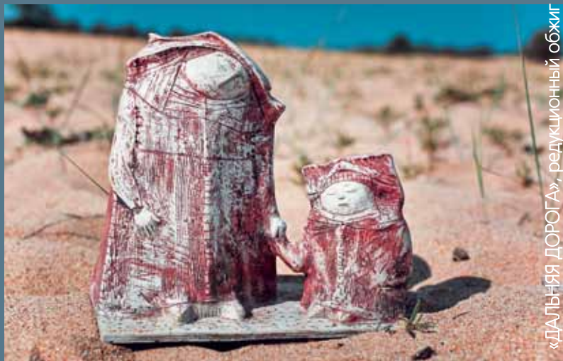
«ДАЛЬНЯЯ ДОРОГА», редуционный обжиг

Мы на керамических симпозиумах были неоднократно: два раза в Бобруйске, в Перми, в Кировской области в селе Рябово. Здесь нам очень нравится, подобралась хорошая группа, все вместе, каждый делится опытом. Кажется, ведь все уже известно, а какие-то мелочи открываешь для себя, и они очень нужны. Про организацию симпозиума можно сказать одно – она грамотная, все